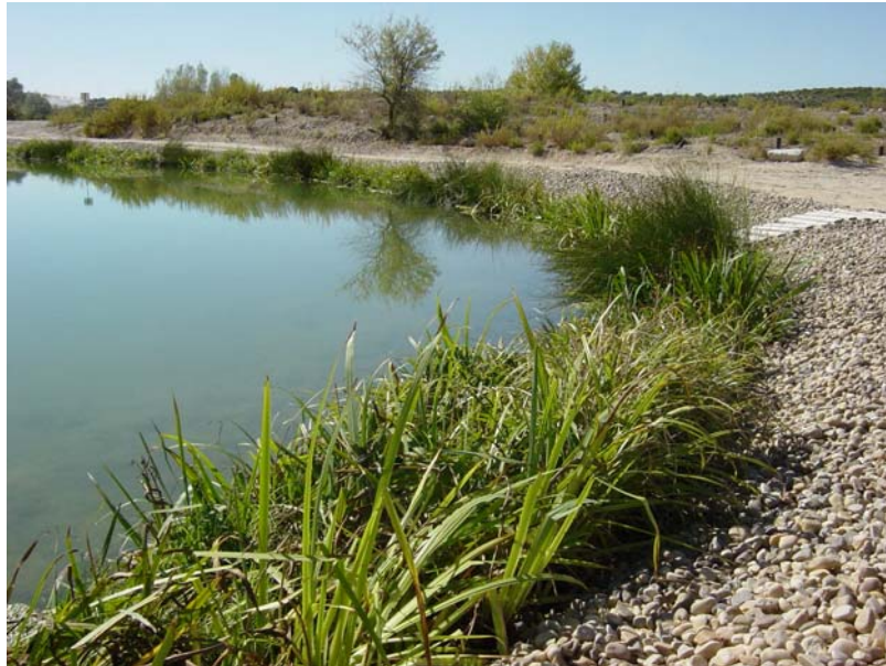
Imatge després de l'execució. Detall de marge amb estructures vegetades.