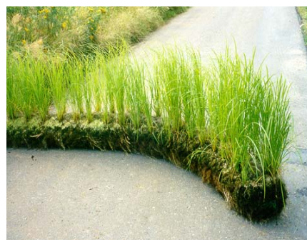
Plant plug™ de lliri groc