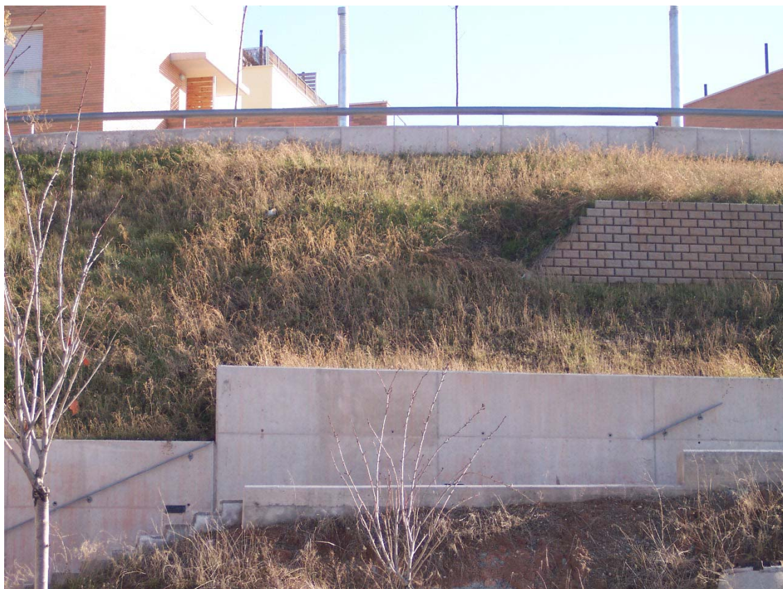
Imatge 1 any després de la instal·lació de la geomalla.