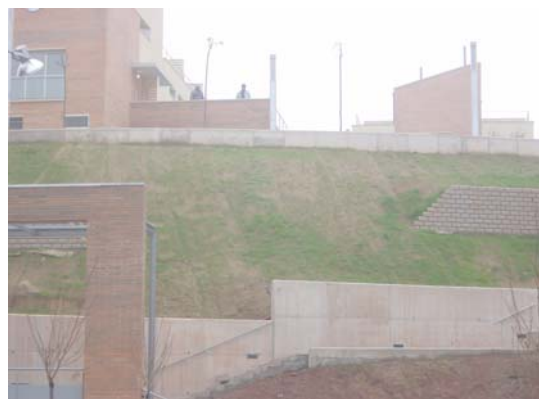
Imatge abans i un cop instal·lada la geomalla