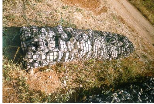
Rock roll TM

- Instalación de 410 m.l de Rock roll TM o gaviones flexibles a la totalidad de la base del lecho de ambas márgenes del torrent de Palau para evitar la posible socavación del lecho.