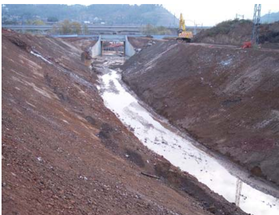
Reperfilado de los taludes.