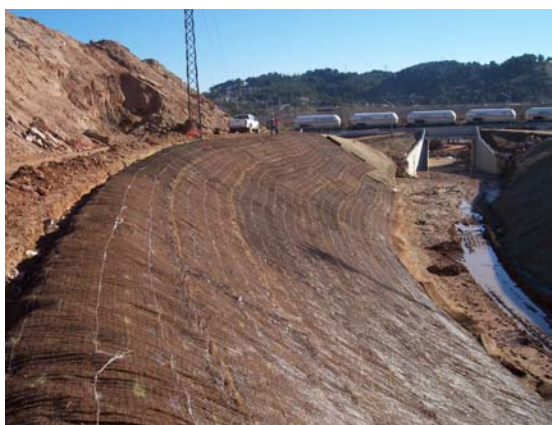
Instalación de la geomalla a lo largo de todo el talud.