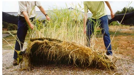
Plant pallet TM