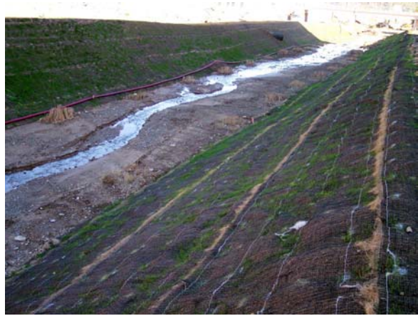
Dos semanas después de finalizar la obra.