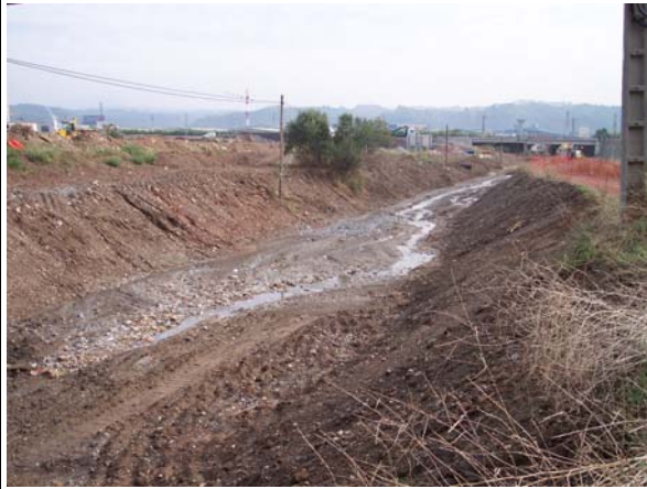
Posteriormente a los trabajos de desbroce.