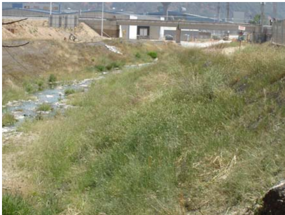
Desarrollo de la vegetación introducida en la riera a lo largo del verano.