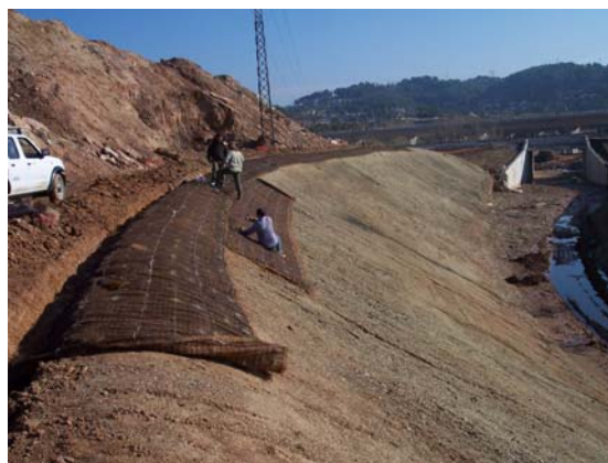
Hidrosiembra y anclaje superior de la geomalla C350.