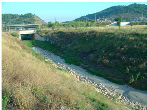
3 años después de finalizar la obra.