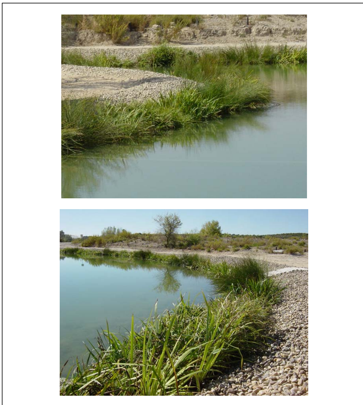
Imagen después de la actuación. Detalle de margen con estructuras vegetadas.