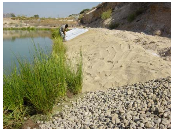
Imágenes de distintas fases de la actuación.