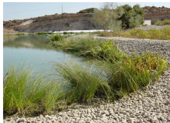
Imágenes antes y después de la obra