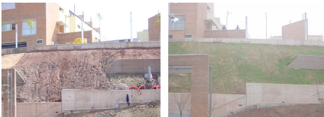
Imagen antes y una vez instalada la geomalla.