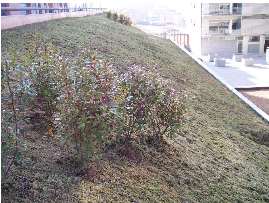
Imagen 1 año después de la instalación de la geomalla.