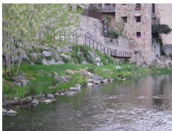
A la izquierda vista general de la zona de trabajo. Y a la derecha el margen del río Fluvià después de las actuaciones.