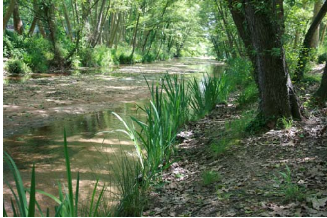
Imágenes de los Fiber rolls™ en el margen de la riera