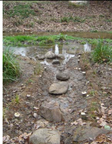
Foto izquierda: Plant plugs™ instalados en la base de un entramado, estructura de ingeniería naturalística