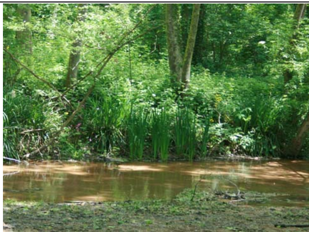
Foto izquierda: Plant Carpet™ justo después de ser instalado (invierno 08)