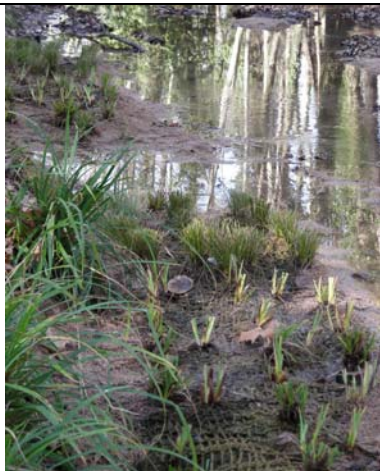
Foto derecha: Fiber rolls™ instalados en los márgenes de la salida de un drenaje