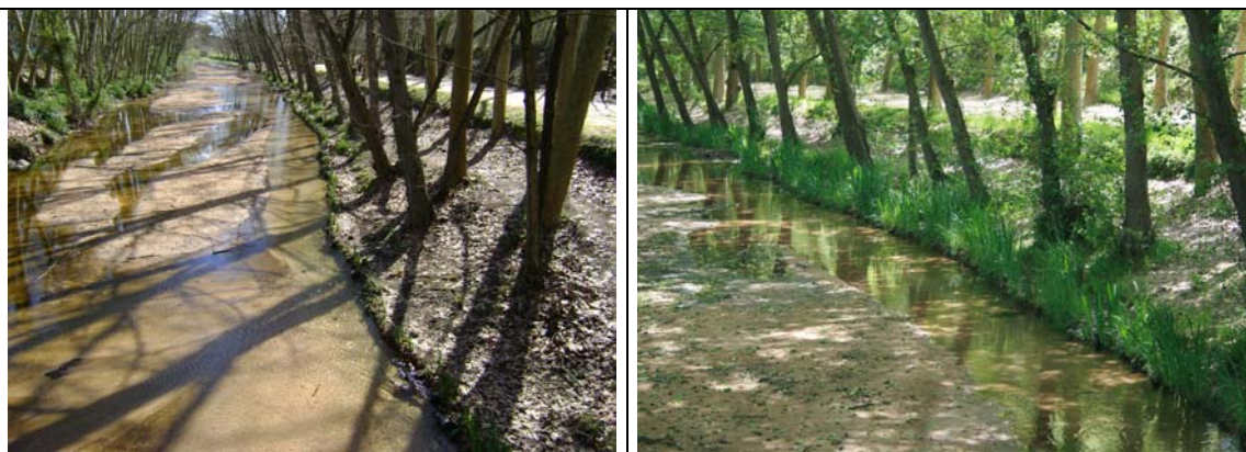
Foto izquierda: Fiber rolls™ después de la instalación (Invierno 2008)