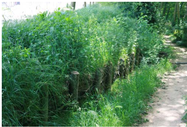
Fajinas de ramaje seco para la protección de la rampa de acceso a la riera