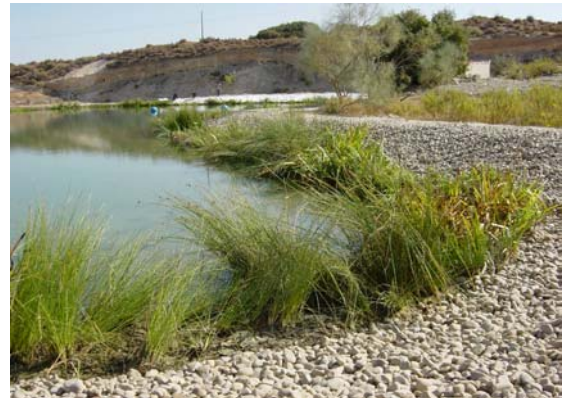
Imágenes antes y después de la obra