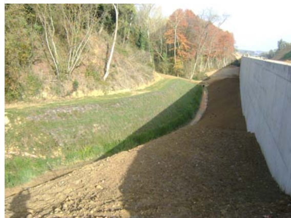
En la darrera imatge l'aspecte 6 mesos després de l'actuació, on es pot apreciar que encara no s'havien començat els treballs del marge dret.