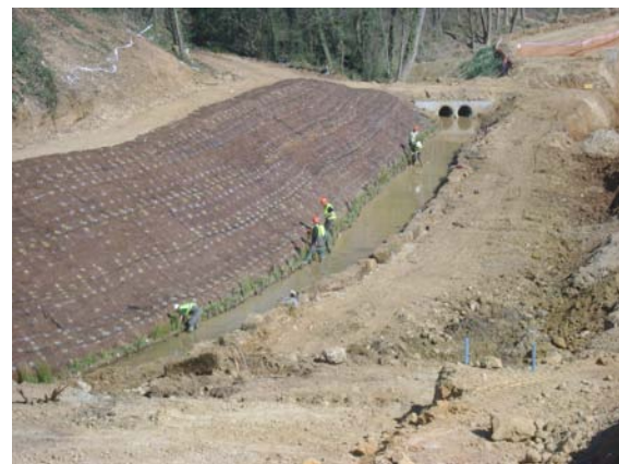
Procés de instal·lació de la geomalla permanent C350 Vmax i fixació amb estacues del Fiber Roll™ vegetaltitzat a la base del marge esquerra.