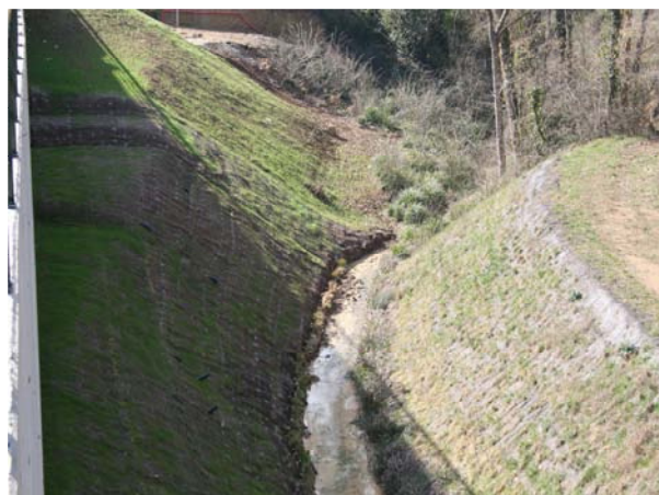
Vista general dues setmanes després de la finalització dels treballs del marge dret.