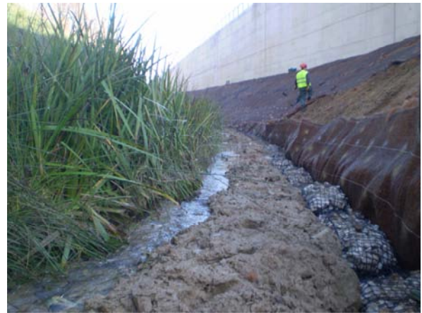
Imatges dels treballs en el marge dret, on es repeteix l'actuació executada en el marge esquerra.