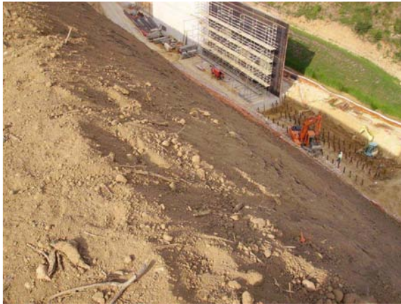
Imatge de la construcció del mur de contenció de la traça de la LAV. A l'altra banda del mur s'aprecia el marge esquerra ja vegetat.