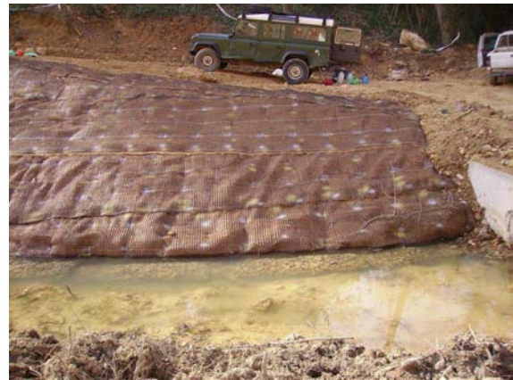
Imatges del gabió flexible Rock Roll™ fixant la geomalla i estabilitzant la base per la posterior instal·lació del Fiber Roll™.