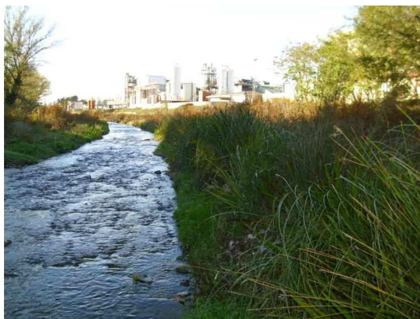
Imatges de la instal·lació del Fiber Roll™ vegetaltitzat del gener de 2010, i 10 mesos després.