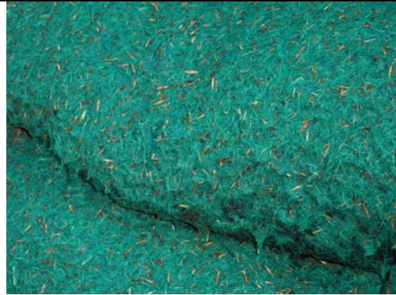
Detalle de la hidrosiembra del muro