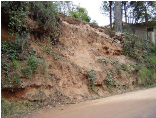
Imagen del margen antes de iniciar las obras