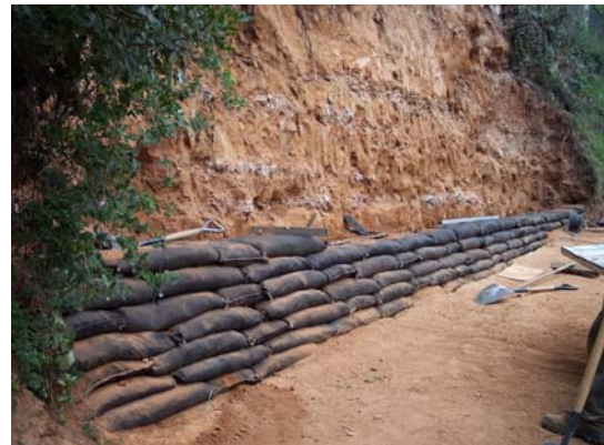
Diferentes detalles del proceso constructivo