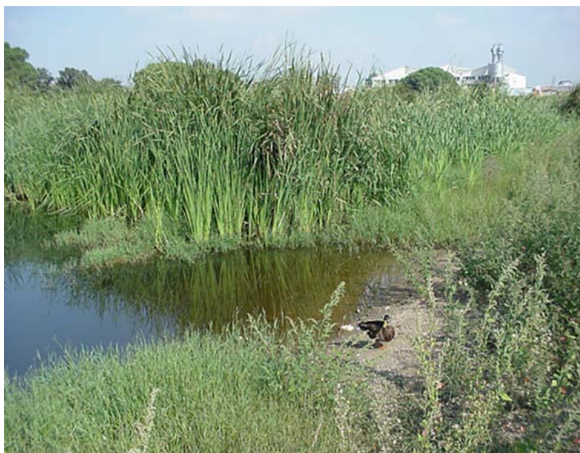
Los humedales son utilizados por las aves como hábitat.