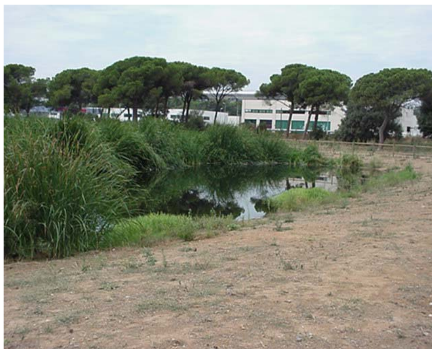
Imagen actual de los humedales.