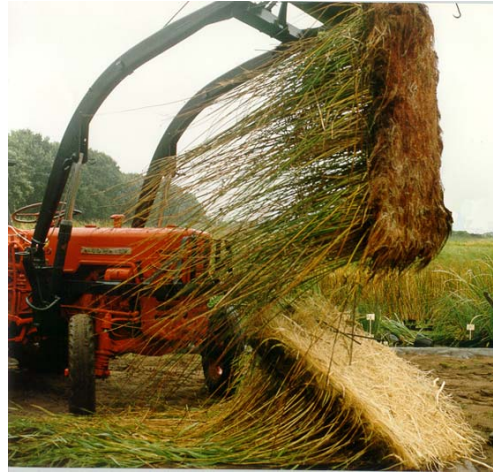
Plant pallet TM

-Plantación de plántulas de enea y carrizo para favorecer cierta cobertura en los espacios vacíos entre las estructuras de fibra.