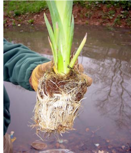
Plant plug TM de lirio amarillo