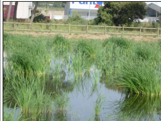
Imágenes de los humedales