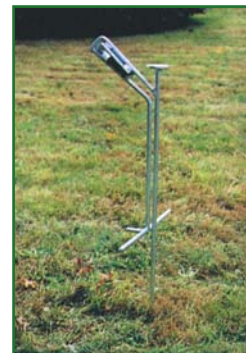
Palo de soporte galvanizado