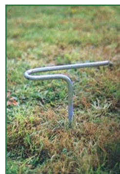
Grapa de sujeción