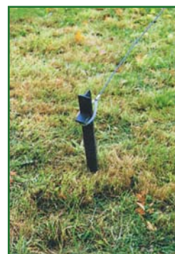
Clavija y cuerda