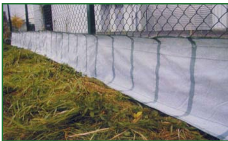
Valla móvil versión light